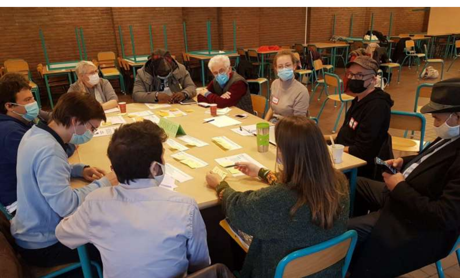
Réunion du Conseil Citoyen Forestois du 20 novembre 2021